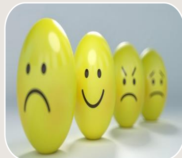
Emocje i stres